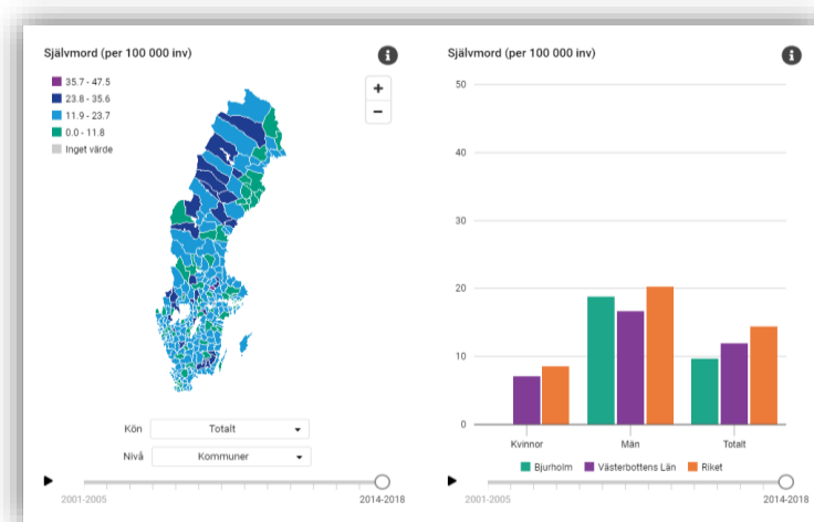
Figur 1

Statistik anger att 70% av de självmord som begås sker av män, men samtidigt är det fler kvinnor än män som genomför självmordsförsök. Risken för självmord bland män är även dubbelt så hög i glesbygd som i storstäder medan själva förekomsten bland kvinnor är rätt så likartad 3 . Under perioden 2014 - 2018 tog 9,7 invånare/100 000, i åldern 15 år och uppåt, livet av sig i Bjurholm. Det angivna antalet avser medelvärdet under perioden. Under motsvarande period var medelvärdet av antal självmord i Västerbottens län 11,9 och i riket 14,4, se figur 1.