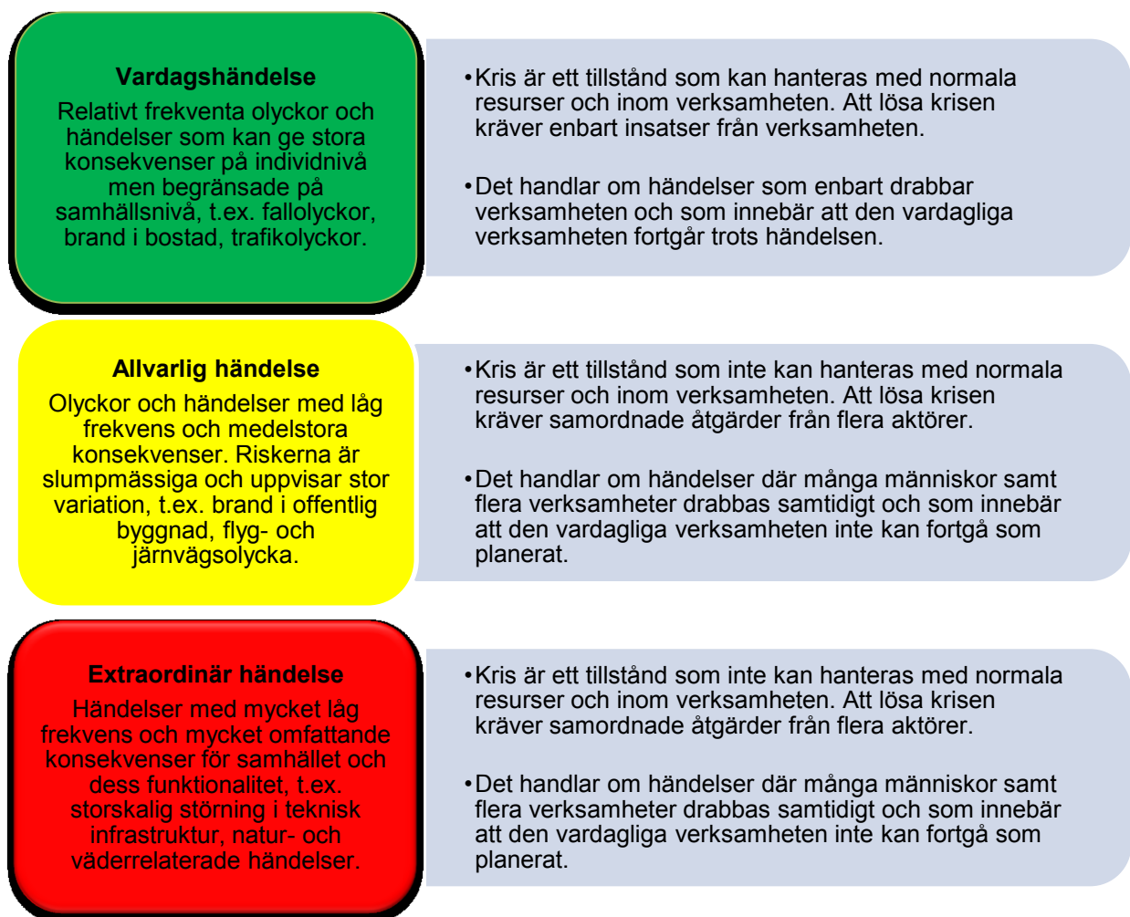
Figur 1. Denna figur beskriver samt förklarar de tre beredskapsnivåerna.

Bjurholms kommuns krisberedskapsplanering utgår från tre beredskapsnivåer; vardagshändelse, allvarlig händelse och extraordinär händelse. Dessa nivåer visualiseras enligt ”stoppljus-färgerna”; grönt, gult och rött.