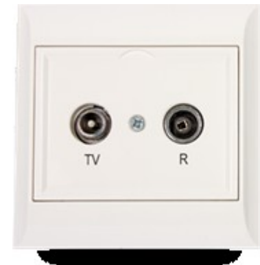
Bild 4 är exempel på ett TV-uttag. Uttaget monteras bredvid fiberkonvertern om du beställer kabel-TV.

Bild 1/2/3 är exempel på olika generationer av fiberkonvertrar i Bjurholms NET. Fiberkonvertern är lådan där fiberkabeln ansluts i ditt hus.