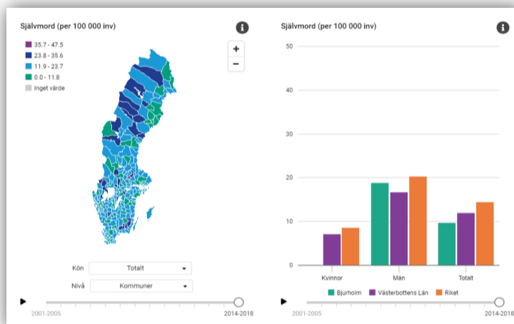
Figur 1 Hämtat från Kommunfakta, Folkhälsomyndigheten

Medan olyckstalen inom trafiken successivt minskat har inte motsvarande minskning skett avseende självord då antalet självord årligen legat på ungefär samma nivå sedan 2008, då handlingsprogrammet beslutades, se figur 2 5 .