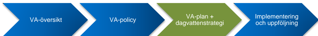
Figur 1. Flödesschema över VA-planeringen. VA-planen är det tredje steget i processen

Tidigare har dagvatten hanterats genom att snabbt leda bort vattnet via ledningar till recipient. Detta ställer höga krav vid förändrade flöden i ledningarna - extrema skyfall kan göra att de bli överbelastade med översvämningar som följd. En alltför snabb bortledning av dagvattnet har även som följd att stora mängder föroreningar släpps ut orenat i sjöar och vattendrag. Idag finns kunskapen om att en mer öppen och fördröjd hantering av dagvatten förhindrar den nämnda problematiken. Dagvattnet kan till och med anses som en resurs i mark- och vattenplanering när växtbäddar, dammar eller kanaler skapas i tätorten för att bidra till trivsamma miljöer.