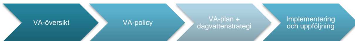
Figur 1. Flödesschema över VA-planeringen. VA-planen är det tredje steget i processen

Infoga bild Figur ett Flödesschema över VA-planeringen.