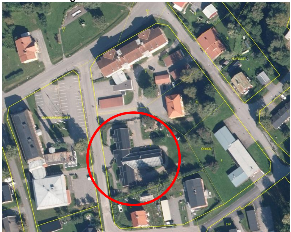
Bild Örnen 3